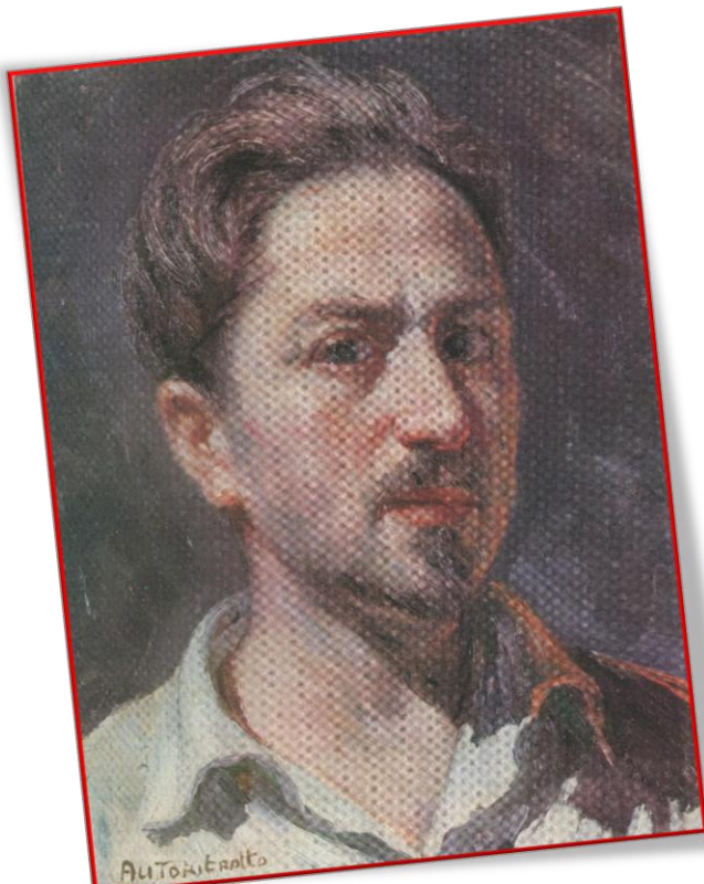
A. Grassi - Autoritratto 1946 (olio su tela 30x40)

Alfonso Grassi: "Poeta e Signore del Colore"