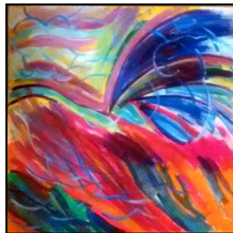
Bird - Acrilico su compensato

Galleria Internazionale "Alfonso Grassi"