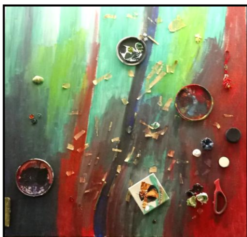
Nel Percorso blu - Tecnica mista